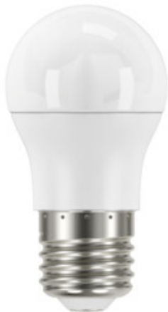
IQ-LED G45E27 7,2W