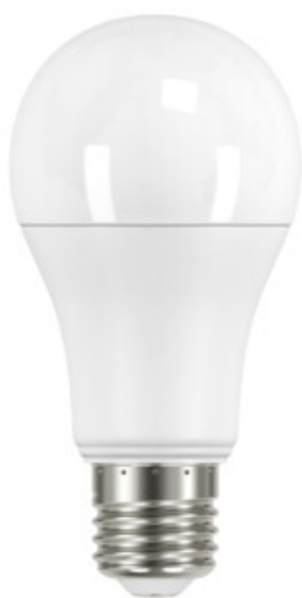
IQ-LED A60 13,5W