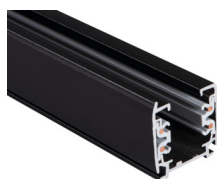
33232 TEAR N TR 2M-W

Element systemu szynowego, TEAR N TR 2M-W, szynoprzewód 3-obwodowy, biały, (33232)