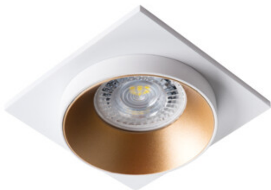
SIMEN DSL W/G/W