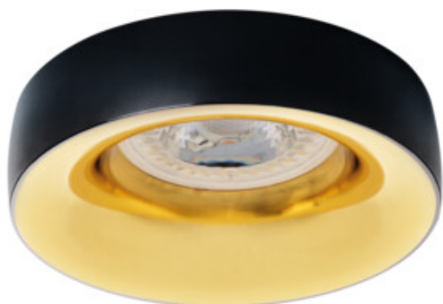
ELNIS L B/G