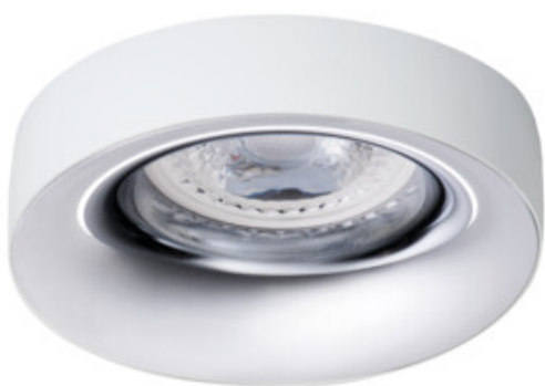
ELNIS L W/C