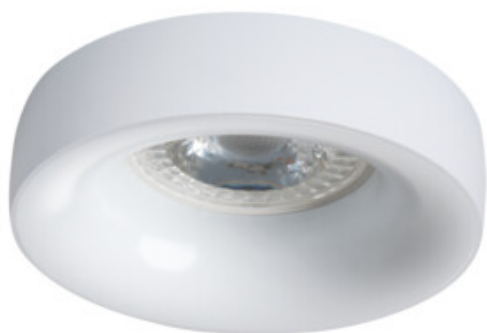
ELNIS L W