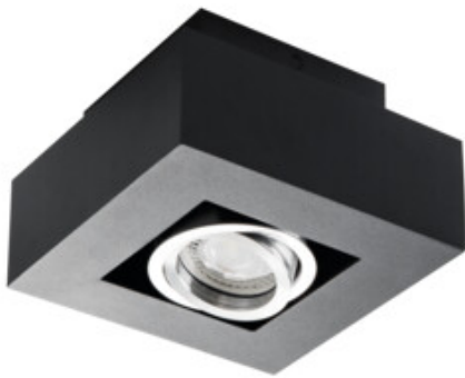
STOBI DLP 50-B