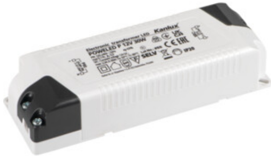
POWELED P 12V 30W