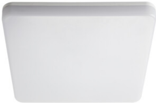
VARSO LED 24W-L; VARSO LED 24W-L-SE