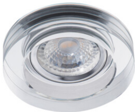
MORTA B CT-DSL50-B