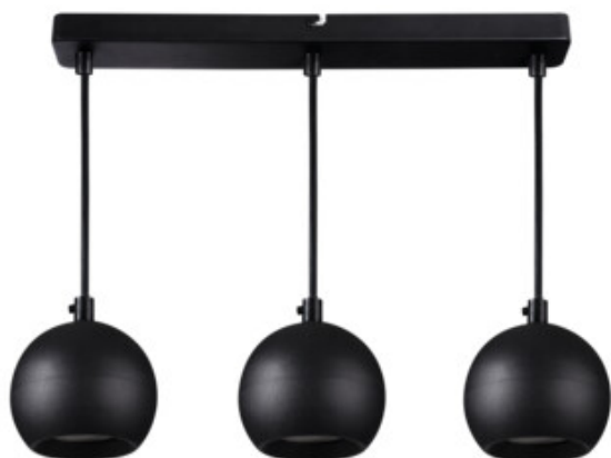
GALOBA C 3xGU10 B