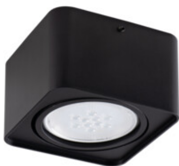
TUBEO ES 50-B