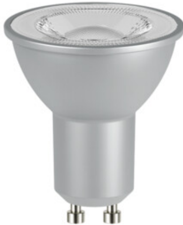
IQ-LED GU10 7W S3