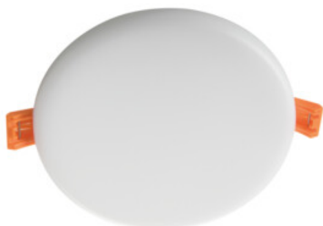
AREL LED DO 10W