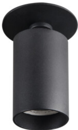
CHIRO GU10 DTO-B