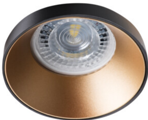
SIMEN DSO B/G