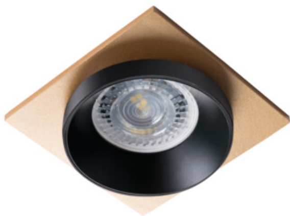
SIMEN DSL B/B/G