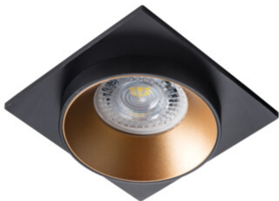
SIMEN DSL B/G/B