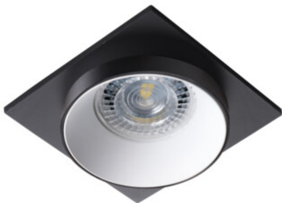
SIMEN DSL B/W/B