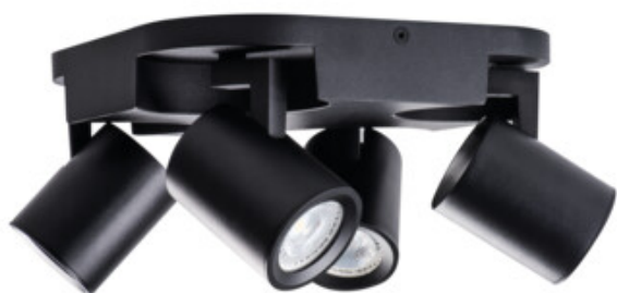
LAURIN EL-40 B