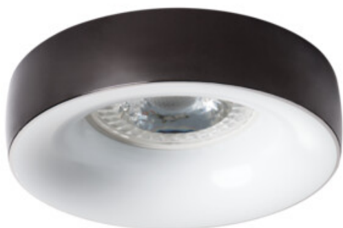
ELNIS L A/W