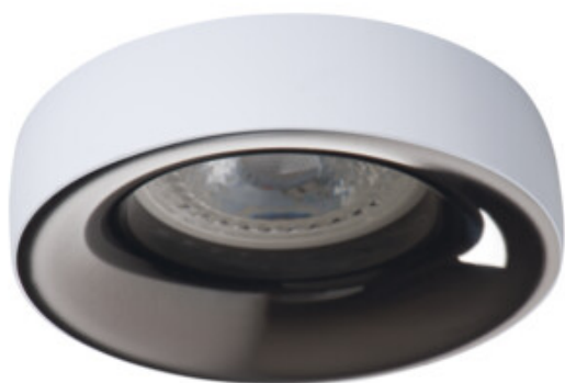
ELNIS L W/A