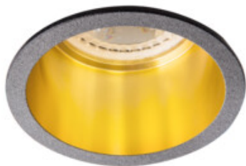
SPAG D B-G