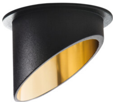
SPAG C B-G