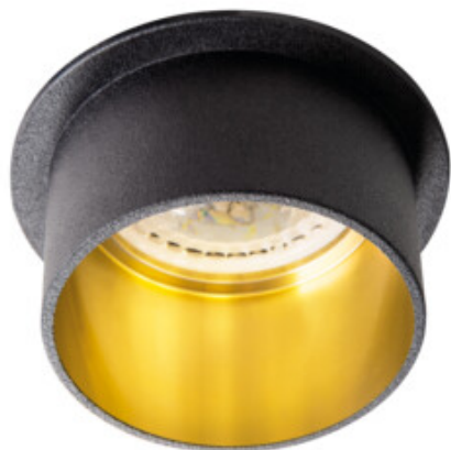
SPAG S B-G