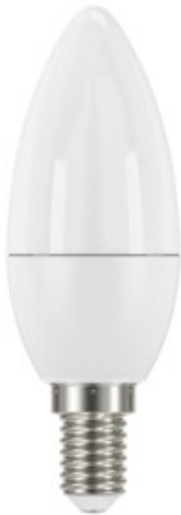
iQ-LED C37E14 5,5W