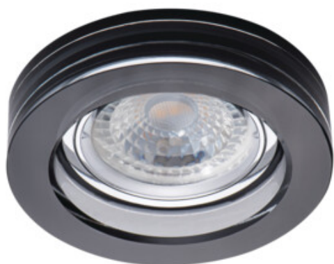
MORTA B CT-DSL50-B