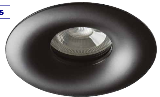
DROXY IP65 DSO-B 33126