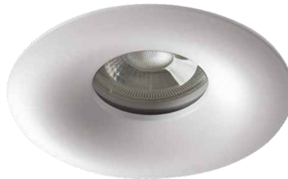
DROXY IP65 DSO-W 33125

Dwa kolory do wyboru: biały matowy i czarny matowy.