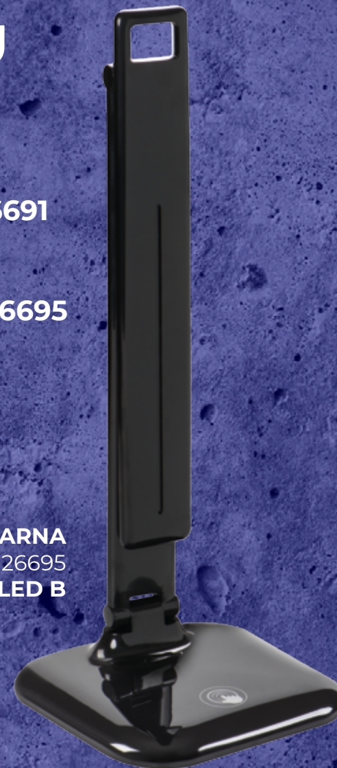
CZARNA 26695 DOSAN II LED B