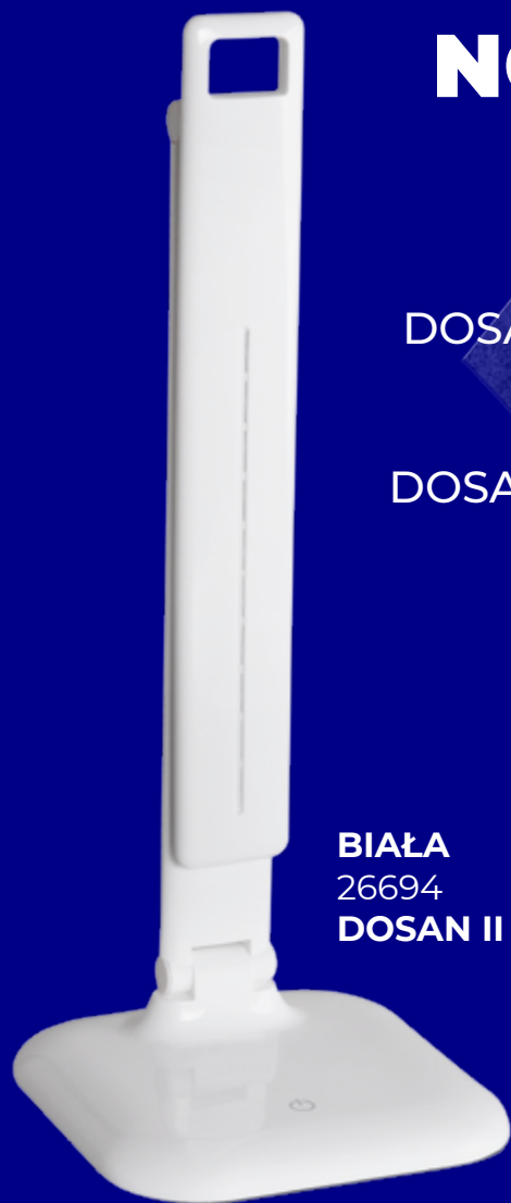
BIAŁA 26694 DOSAN II LED W